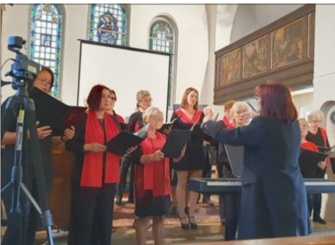
Der Neudietendorfer Gesangverein bei der Eröffnung der 4. Thüringer Adjuvantentage