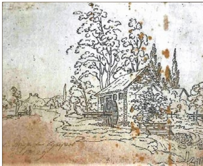
Die Ölmühle 1829, N.Ch.H. Dornheim, Angermuseum Erfurt