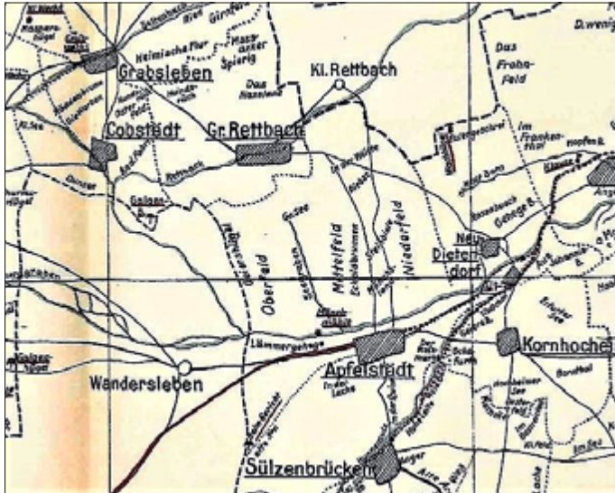
Kartenausschnitt aus der „Generalkarte des Herzogl. Vermessungsbüros in Gotha“; bearbeitet durch Luise Gerbing, 1910