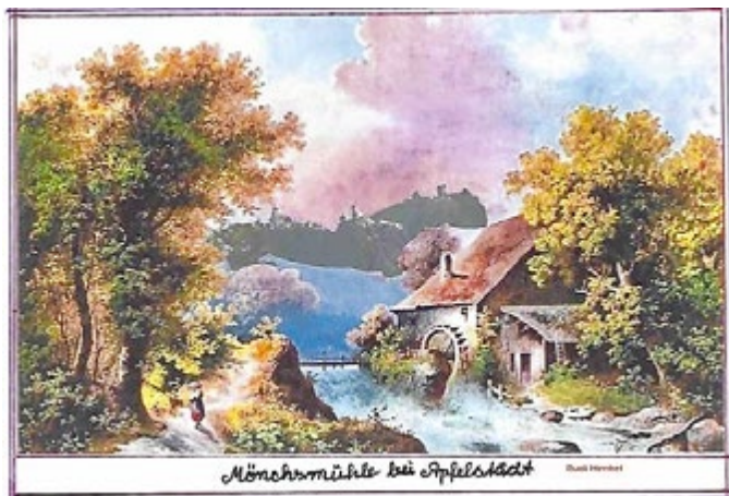
Die Mönchsmühle, fiktiv erstellt durch Rudi Henkel

Die „Mönchsmühle“ wurde dem Dorfe gegen einen jährlichen Erbzins von 10 Schillingen (Pfennigen) überlassen; dagegen sollte das Hirtenhaus hierfür keinen Erbzins zahlen. [lt. Linz] 1758 stand die Mühle noch, sie gehörte der Gemeinde [lt. Brückner].