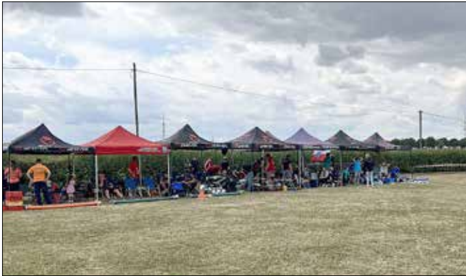
„Die Mannschaften sind bereit“

den. Spannend ist es auf alle Fälle und die sportlichen Leistungen müssen sich vor anderen stärker im Fokus der Gemeinden stehenden Sportarten nicht verstecken. Und wie schon erwähnt - alles im Interesse der Freiwilligen Wehren und damit für die „breite Allgemeinheit“.