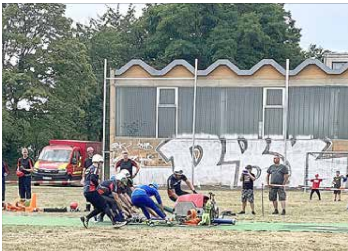
„Das Startsignal ist gegeben. Der Kampf gegen die Uhr hat begonnen.“