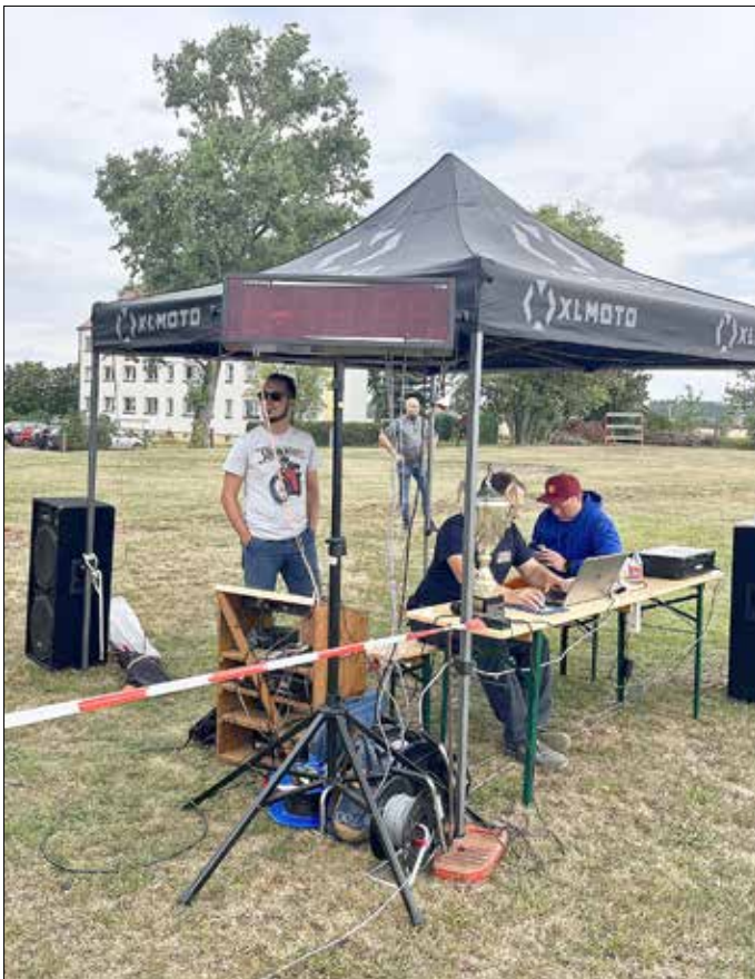
„Das Kampfgericht hat alles im Blick“