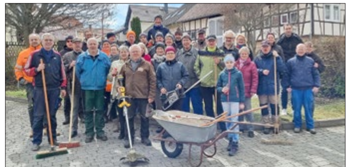
Gemeinsames Engagement in Kornhochheim: Frühjahrsputz am 09.04.2022